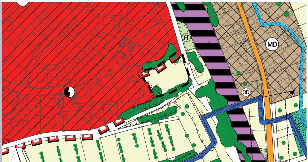
Abb. 1: Auszug aus dem wirksamen Flächennutzungsplan (2004) mit Umgrenzung des Änderungsbereichs (unmaßstäblich)

Der wirksame Flächennutzungsplan des Marktes Winterhausen mit integriertem Landschaftsplan stammt aus dem Jahr 2004 (Erteilung der Genehmigung des Landratsamts am 08.01.2004). Seitdem ist eine Änderung durchgeführt worden. Diese erfolgte im Jahr 2009 zur Darstellung von Flächen für die Landwirtschaft anstelle von Flächen, für die ein städtebaulicher Rahmenplan aufgestellt werden sollte.